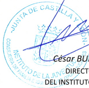
César BURÓN ÁLVAREZ DIRECTOR GENERAL DEL INSTITUTO DE LA JUVENTUD